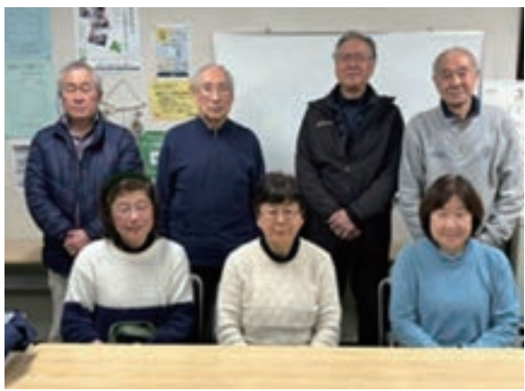
実行委員会のメンバー