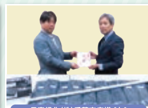
日産緑化(株)千葉支店様 [左]