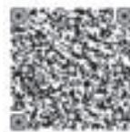
アウトリーチ支援員▶