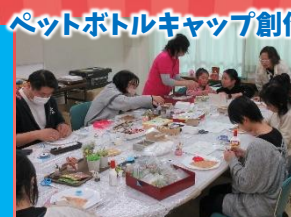
ペットボトルキャップ創作