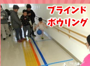
ブラインド ボウリング