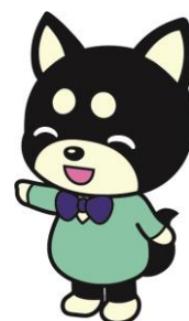
成年後見制度キャラクター「後犬ちゃん」