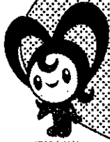
千葉市社会福祉協議会 マスコットキャラクター ハーティちゃん