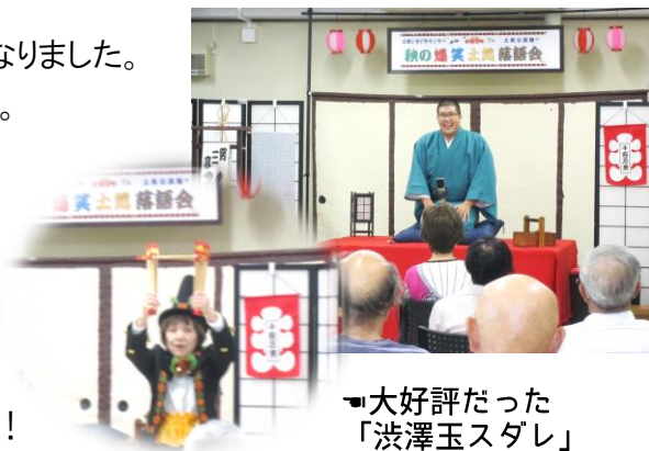
大好評だった 「渋澤玉スタレ」