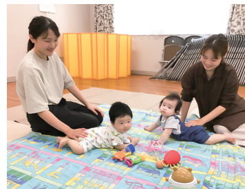
千葉市社会福祉協議会地区部会が行う子育てサロンの様子です。