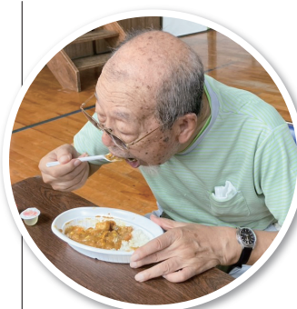
▲部長もいただきます!

完成したカレーは小学校の体育館で振舞われます。会場は地域の子どもたちで大賑わい。カレーを待つ間には高校生のボランティアのお兄さんお姉さんが遊んでくれました。