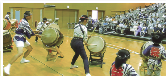
▲長寿を祝い交流を深めます

区域内で開催される敬老祝賀会へ協力しています。そのうちのひとつ、千葉寺青葉町自治会では和太鼓、フラダンス、社交ダンス、大正琴など演者は地元の方々です。加えて町内自治会、民生委員など住民同士が連携、協力し、温かくにぎやかな会が催されています。