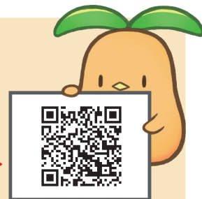
千葉県共同募金会 マスコットキャラクター 「びわびよ」