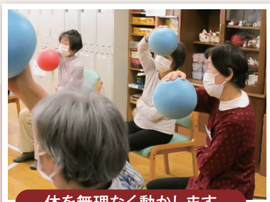
体を無理なく動かします