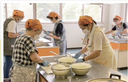
▲調理場では連携プレーが光ります

抜群のチームワークで、100人以上のカレーを作っていきます。今日はキーマカレー。なすとコーン入りです。チキンカレーやドライカレーなど、毎回色々なカレーを作ります。