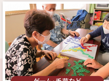
ゲーム・手芸など