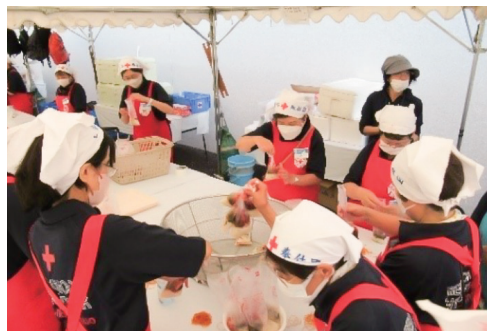
写真は九都県市防災訓練での炊き出しの様子です。

日本赤十字社 千葉県支部千葉市地区本部(千葉市社会福祉協議会内) 〒260-0844 千葉市中央区千葉寺町1208-2 千葉市ハーモニープラザ3F TEL:043-209-8867 FAX:043-312-2442