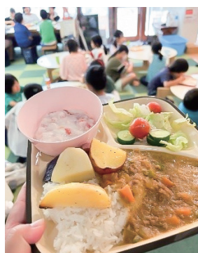
地域の居場所づくりに関する活動を行う団体の活動資金として活用しました。写真は、子ども食堂の様子です。