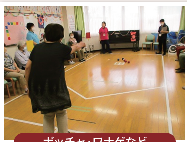
ポッチャ・ワナゲなど