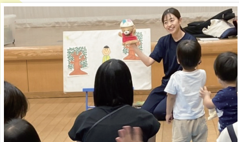
▲すてきなすてきなぼうし屋さん♪(保育士さんによるパネルシアター)

「子育て中のお父さんお母さんの居場所づくりをしよう」の声から活動が始まりました。地区部会のスタッフをはじめ、ギターやレク、工作等で活動を長く支えてくださる方々、