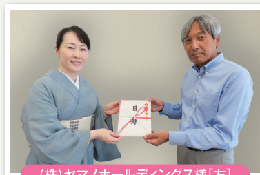
(株)ヤマノホールディングス様[左]