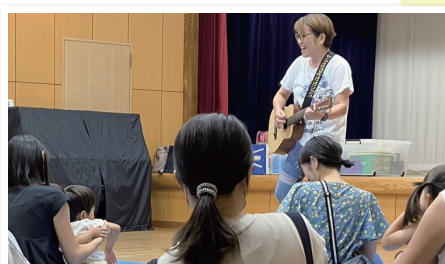
♪ 楽しい時間がふれあいと交流を深めます (荒牧先生によるお歌あそび)

稲毛区健康課の保健師、管理栄養士、歯科衛生士の専門職の方々、学生ボランティアなどが手を取りあって開催しています。お父さん、お母さんたちにとって心強くホッとできる和みの場です。会場の公民館や隣接する保育所との顔の見える関係もまた活動を後押ししてくれています。