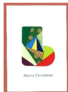
アイリス フォールディング