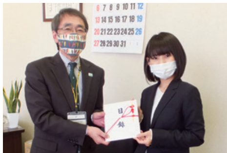
◀ソフトバンク千葉、 ワイモバイルアリオ蘇我様(右)

【物品】 佐瀬 茂行 佐藤 慎一 株式会社セブン-イレブン・ジャパン 株式会社東芝 東関東支店 日産緑化株式会社千葉支店 マルハン千葉北店 マルハン千葉ニュータウン店 マルハン八千代緑が丘店