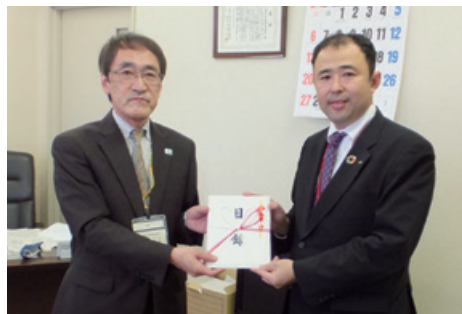
◀「小さな親切」運動 ちばぎん支部様(右)