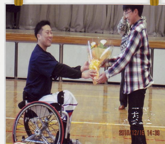
お互いに頑張りましょう