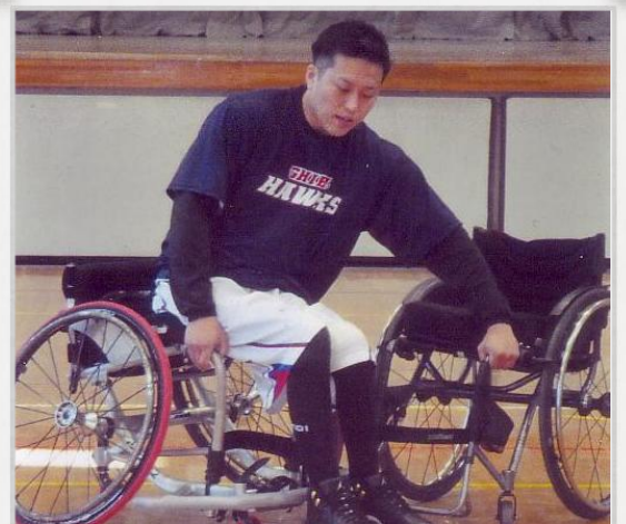
車椅子からの移乗