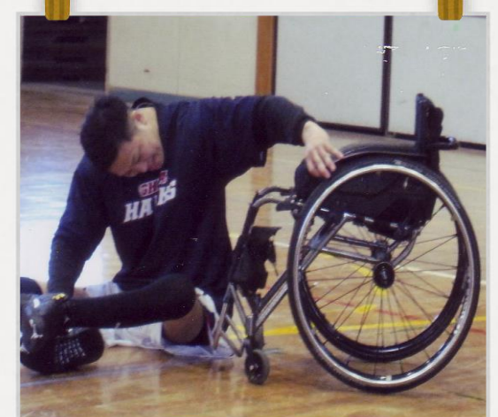
起き上がる時の苦勞