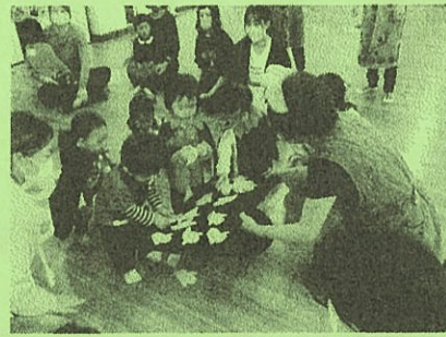
ハロウィン仮装を してオバケ探しに 大盛りあがりの 子どもたち