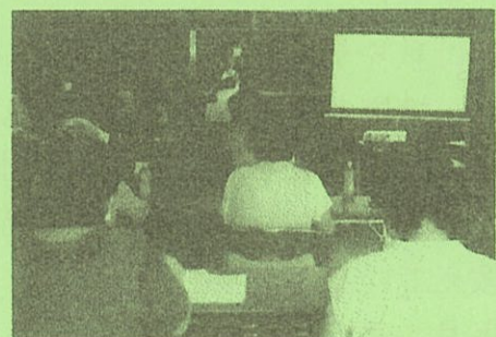
メモを取り熱心に聞いています