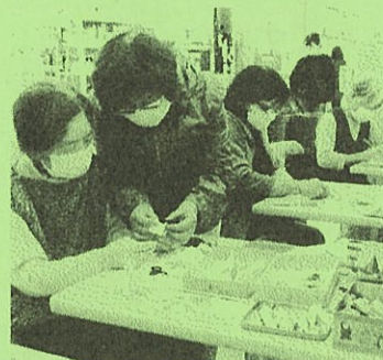
秋の野山に思いを 馳せて作品づくりを 楽しまれていました