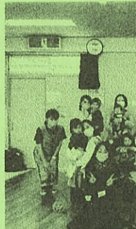
たくさん参加で楽しいハロウィンパーティーでした