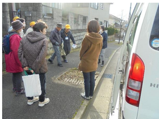
↑①自治会館を出発し、利用者宅ご自宅までお迎え！