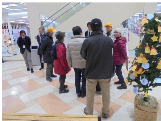
↑③利用者の方は買物へ。 協力員は買物が終わるまで待機。