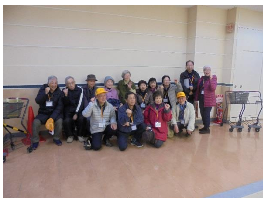
↑みんなで記念撮影