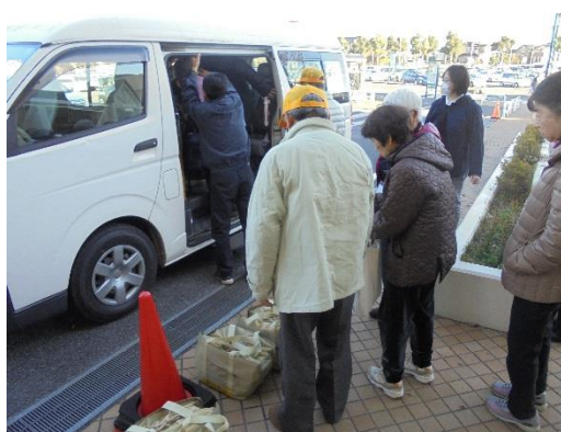
↑④買物終了！重いものは協力員がお手伝い。 この後各家庭に送り届けました。